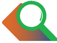
ISPD Green Podcast

Η σειρά αυτή επιχειρεί μια δεύτερη ανάγνωση στην πολιτική επικαιρότητα, έχοντας ως κύριο εργαλείο την επιστημονική γνώση και τον ορθό λόγο. Συζητούμε με ακαδημαϊκούς, εμπειρογνώμονες και πολιτικούς, διασυνδέοντας τον κόσμο των ιδεών και της επιστήμης με την εφαρμοσμένη πολιτική.