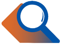
ISPD Politics Podcast

Η σειρά αυτή επιχειρεί μια δεύτερη ανάγνωση στην πολιτική επικαιρότητα, έχοντας ως κύριο εργαλείο την επιστημονική γνώση και τον ορθό λόγο. Συζητούμε με ακαδημαϊκούς, εμπειρογνώμονες και πολιτικούς, διασυνδέοντας τον κόσμο των ιδεών και της επιστήμης με την εφαρμοσμένη πολιτική.