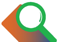
ISPD Green Podcast

Η σειρά αυτή επιχειρεί μια δεύτερη ανάγνωση στην πολιτική επικαιρότητα, έχοντας ως κύριο εργαλείο την επιστημονική γνώση και τον ορθό λόγο. Συζητούμε με ακαδημαϊκούς, εμπειρογνώμονες και πολιτικούς, διασυνδέοντας τον κόσμο των ιδεών και της επιστήμης με την εφαρμοσμένη πολιτική.