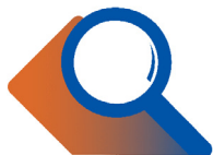
ISPD Politics Podcast